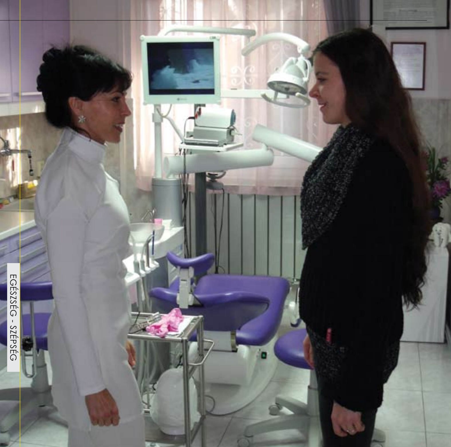
EGÉSZSÉG - SZÉPSÉG